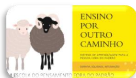
Projeto Ensino por Outro Caminho