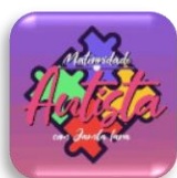
Projeto Maternidade Autista