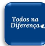
Projeto Todos na Diferença