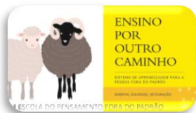
Projeto Ensino por Outro Caminho