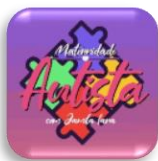
Projeto Maternidade Autista