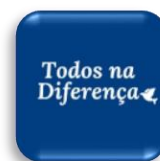
Projeto Todos na Diferença