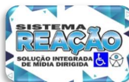
Apoio: Revista / TV Sistema Reação