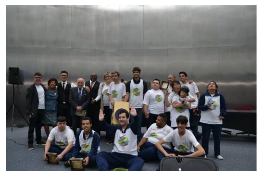
AULA 29 – 03/12 - MEMORIAL DA AMÉRICA LATINA 1º Prêmio Marco da Paz – Inclusão Sem Limites