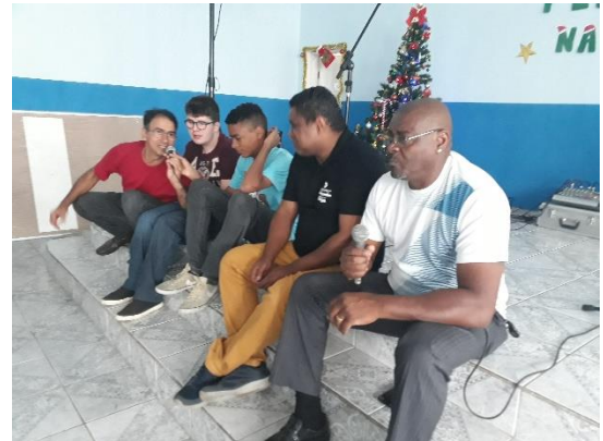
Aula 32 – 20/12/18 Encerramento das atividades