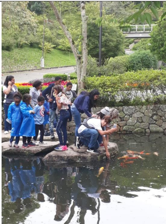
Visita ao SOLO SAGRADO